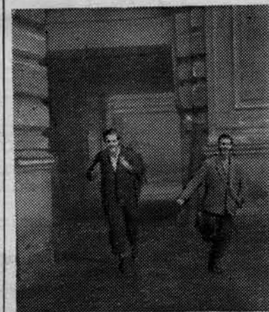
Спурт по звонку...

Организация и проведение соревнований были возложены на судейскую комиссию в составе: Ф. Матковского (II к. с/ф), А. Базылева (III к. п/ф) и Т. Звон-