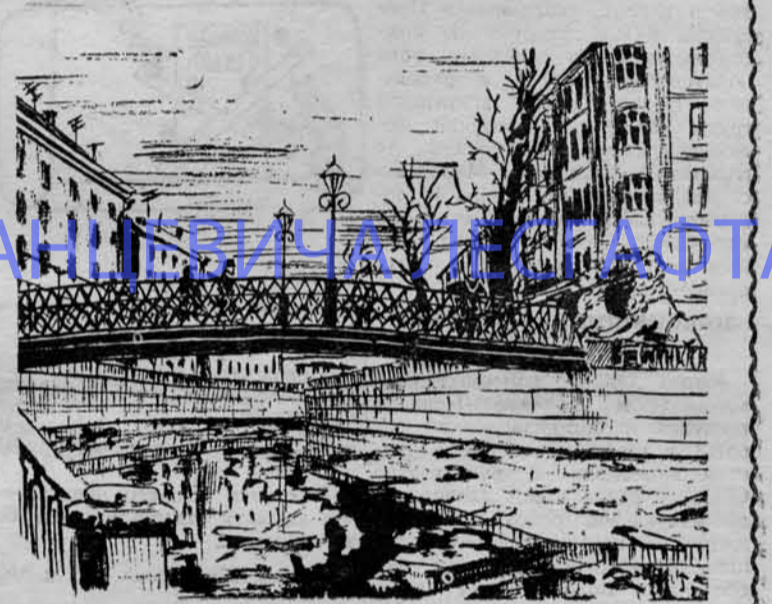
«Львиный мостик». Рисунок, присланный на конкурс.