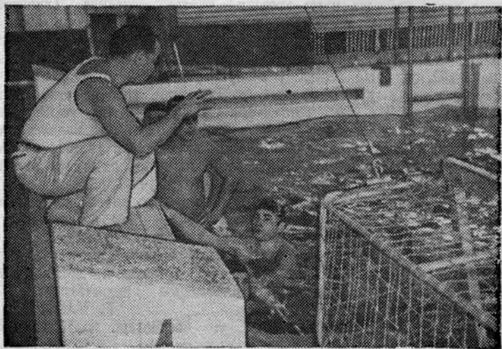
Последний перерыв в матче, последние указания тренера...

В соревнованиях как по классической, так и по вольной борьбе с заметным преимуществом победили команды спортфака.