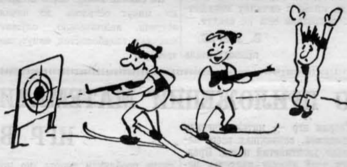
На состязаниях по биатлону. Судья не мешает. Первое место нам теперь обеспечено. Рис. А. Синюрина.