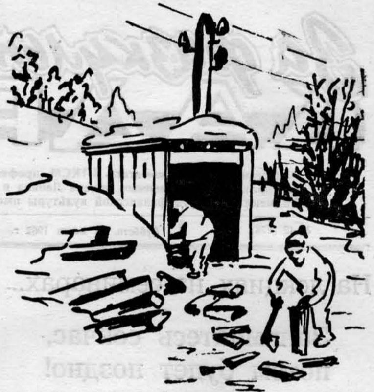
Кавголово. На заготовке дров. (Из рисунков, присланных на конкурс).