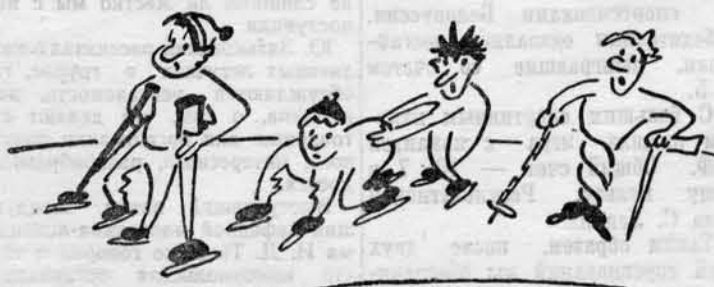
Первый раз на катке...