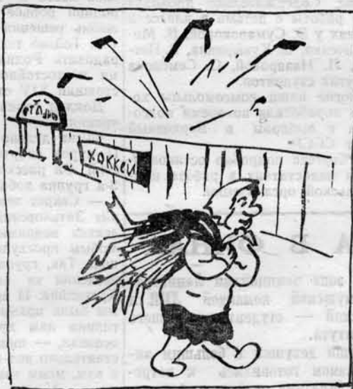
— Откуда дровишки? С хоккея, вестимо.

В. ЛЕБЕДЕВ, преподаватель физического воспитания 260-й школы Октябрьского района