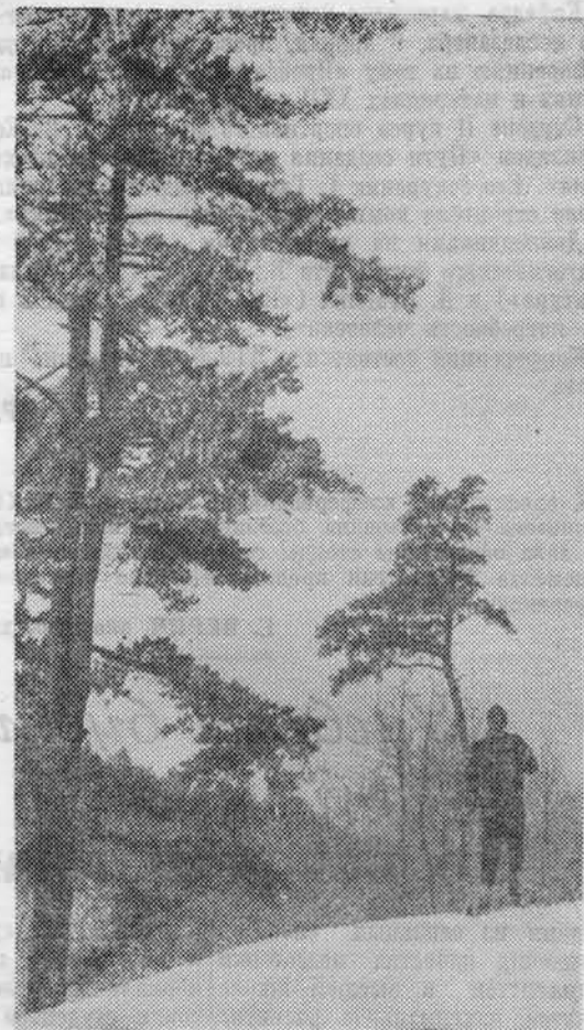
«На Кавголовской круче». (Прислано на конкурс.)