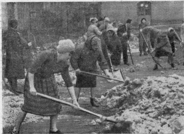
Около ста сотрудников нашего вуза приняли участие в коммунистическом субботнике по уборке территории института, проведенном 7 апреля. Хорошо поработали лесгафтовцы!

На снимке: участники субботника за работой.