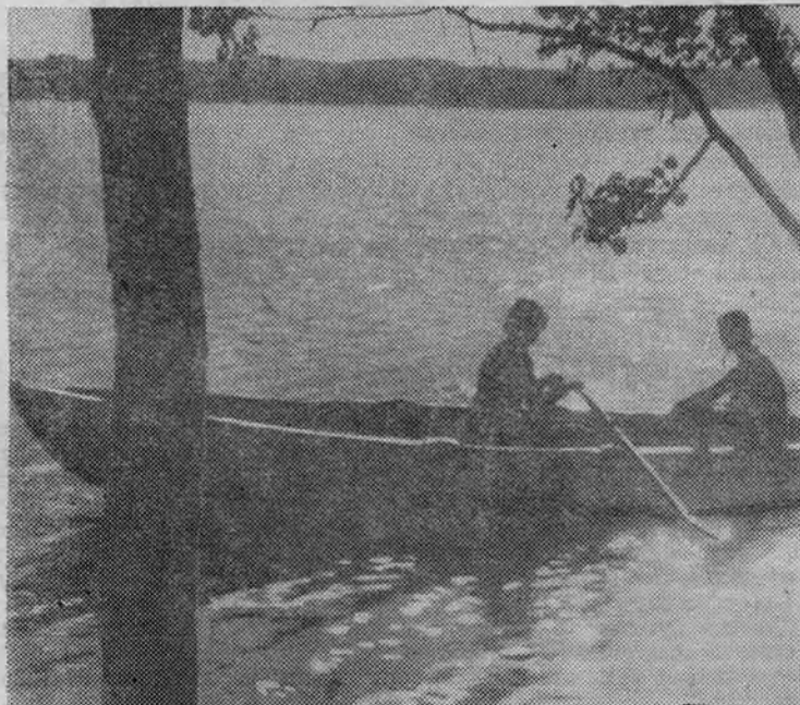
В вечерний час...