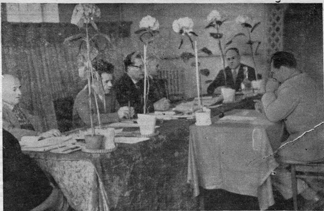
Идут государственные экзамены.