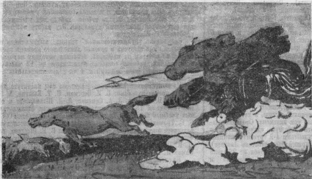
«Утро на стане». Рис. Соль Магсара (Монгольская Народная Республика).