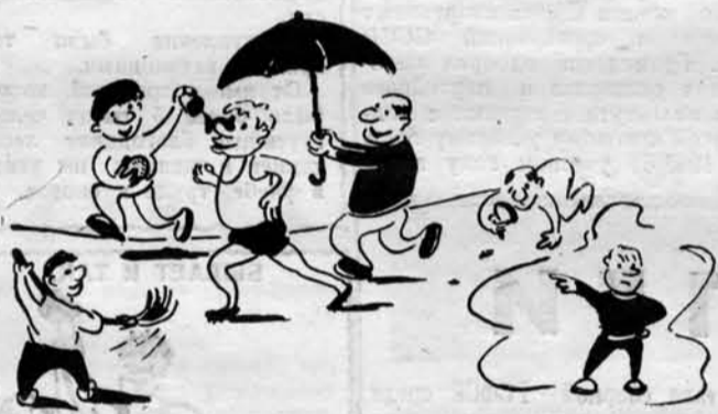
КАВГОЛЕНОК: — Так некоторые студенты представляют себе учебу в институте. Рис. студкора А. Смирнина.