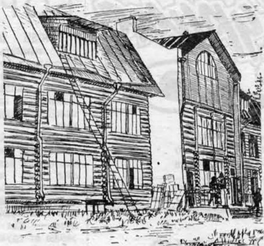
Рисунки студкора И. Попова

выглядывает солнце. Но, несмотря на это, занятия проходят очень интересно и увлекательно. Проводят их опытные преподаватели нашего института.