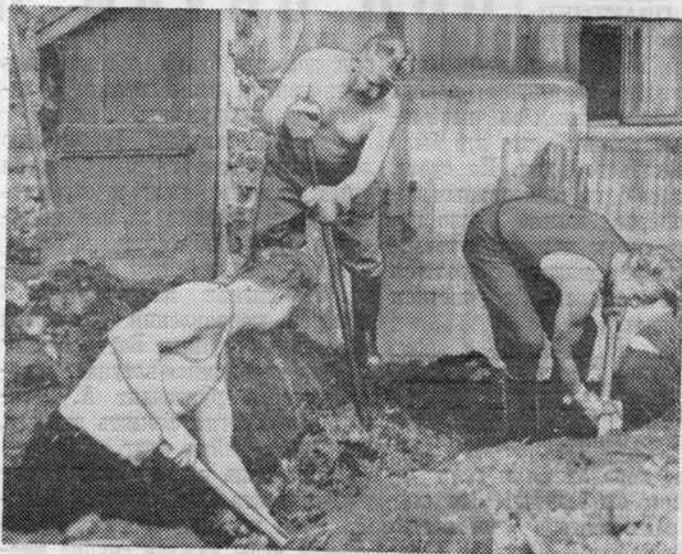
Хорошо потрудились коллектив института в один из воскресных дней на строительстве манежа.