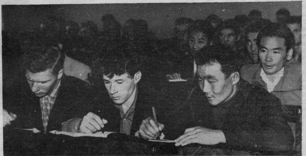
На снимке: второкурсники педфака на первой лекции по политэкономии.