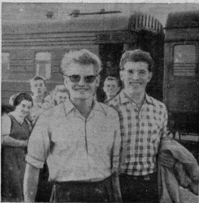
«Здравствуй, незнакомый край целинный!»