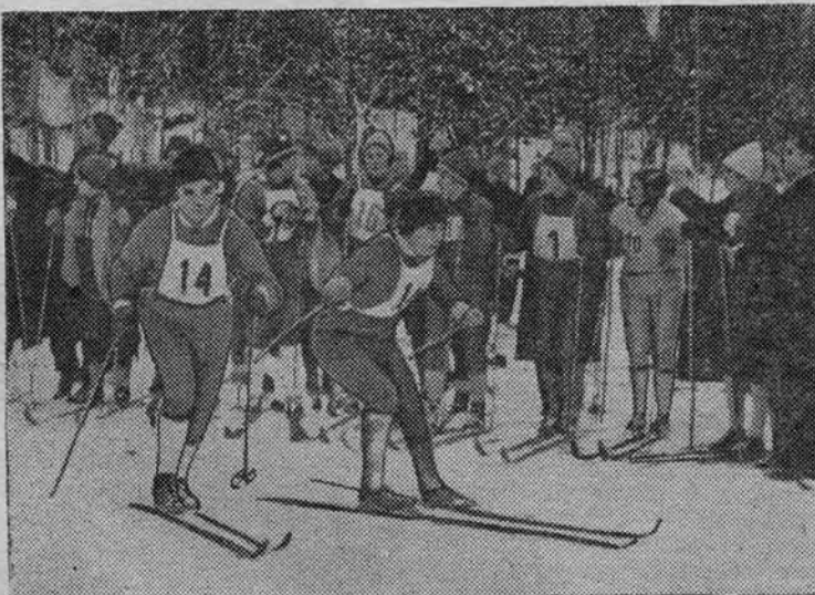
В Кавголове в разгаре зимний сезон. На снимке: на этапе женской эстафеты на приз открытия зимнего сезона.