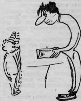
Объявляются оценки за четверть.