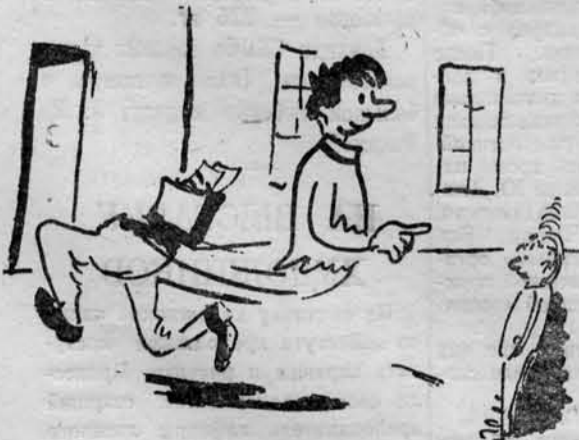
Студент на практике...