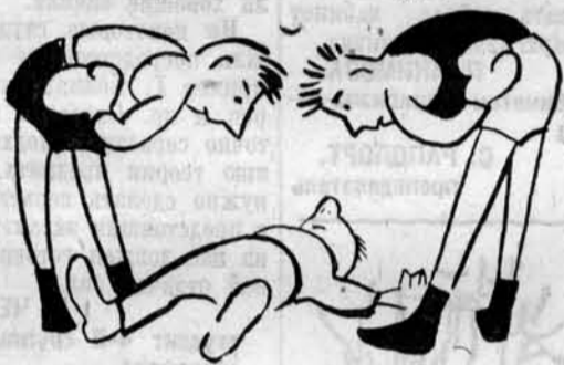
Рис. В. Соловьева