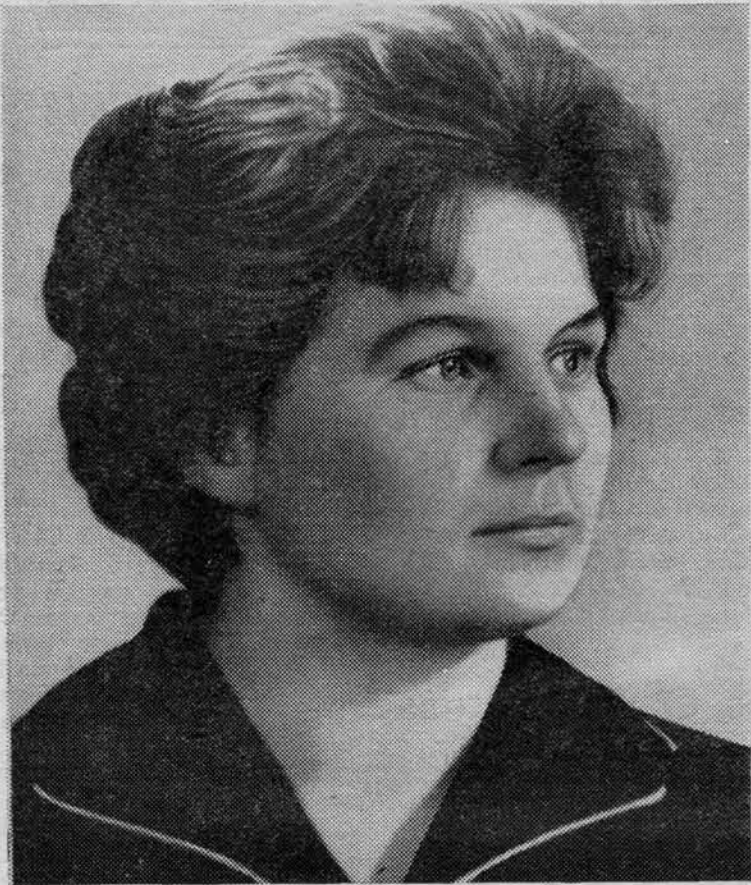
Валентина Владимировна ТЕРЕШКОВА.