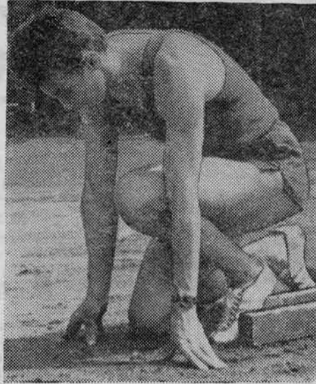
Э. Озолин на тренировке.

Чемпион и рекордсмен страны выпускник нашего института Эдвин Озолин сумел впервые в истории матчей вклиниться между двумя американцами.