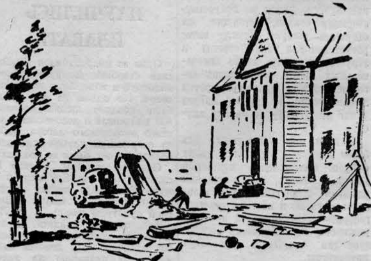
НА ЦЕЛИНЕ. Заканчивается сооружение школы в совхозе «Бескарагайский». Рис. А. Синюрина