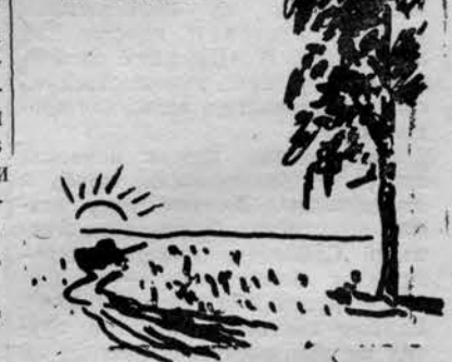
Рис. А. Синюрина