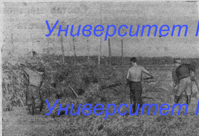
На скирдовании сена.