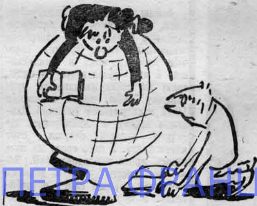
Рис. А. Синюрина