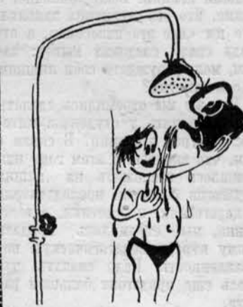
«Проблема душа решена».

Слышим вдруг: «Воды, воды!» Побежали на крик, думали кому-нибудь плохо стало. Вбегаем в