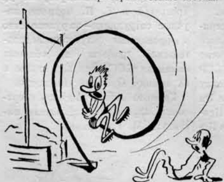
— Кто мне подсунил фиберглассовый шест?

Легкоатлеты института начали осваивать фиберглассовые шесты.