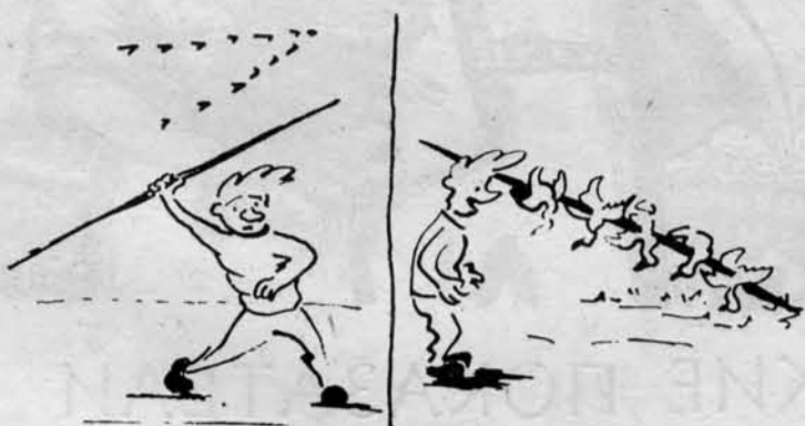
Однажды на весенней тренировке...

Легкоатлеты института начали осваивать фиберглассовые шесты.