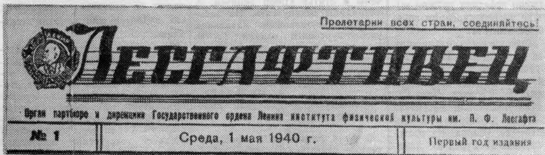
Так выглядел заголовок первого номера нашей газеты.