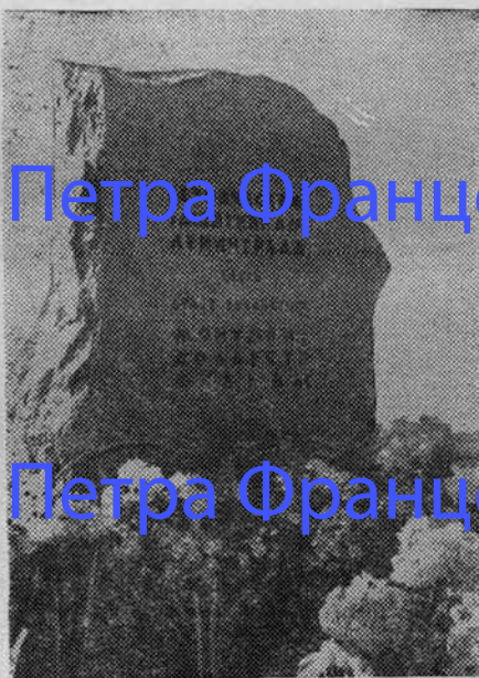
НА СНИМКАХ: в центре — закладной камень монумента доблести и славы; справа — лесгафтовцы возлагают цветы к подножию закладного камня.