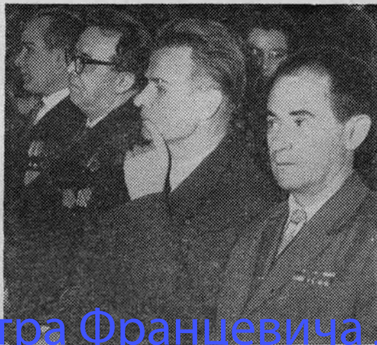
В актовом зале во время торжественного собрания.