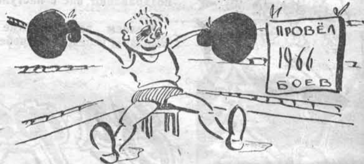
Вступая в Новый год...