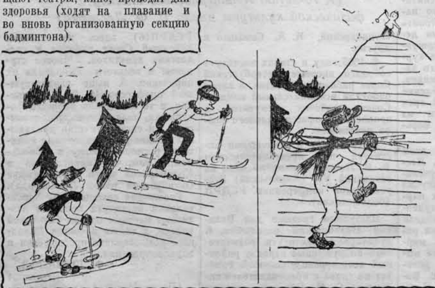
Рис. Т. Зуевой