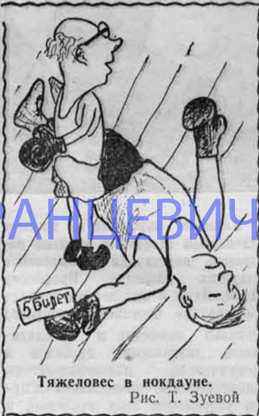
Тяжеловес в нокдауне. Рис. Т. Зуевой