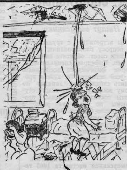
Рис. Т. Зуевой