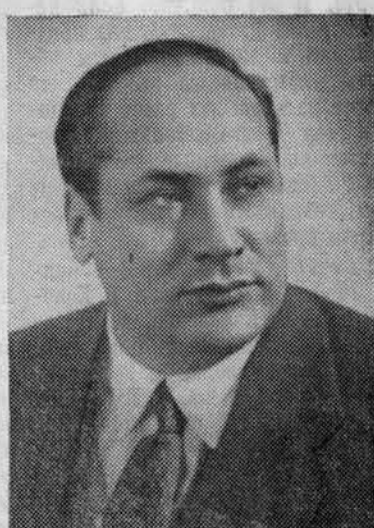
ТОЛСТИКОВ Василий Сергеевич, первый секретарь Ленинградского областного комитета КПСС.