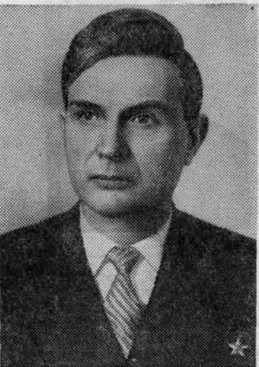
СУСЛОВ Михаил Андреевич, член Политбюро ЦК КПСС, секретарь Центрального Комитета КПСС.