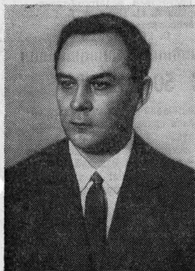
ШЕЛЕПИН Александр Николаевич, член Политбюро ЦК КПСС, секретарь Центрального Комитета КПСС.

★ ЛЕНИНГРАДСКИЙ ГОРОДСКОЙ ИЗБИРАТЕЛЬНЫЙ ОКРУГ № 19