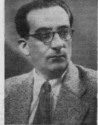
ТОВСТОНОГОВ Георгий Александрович, главный режиссер Академическо-го Большого драматического театра им. М. Горького, народный артист СССР.

★ ПЕТРОГРАДСКИЙ ИЗБИРАТЕЛЬНЫЙ ОКРУГ № 51