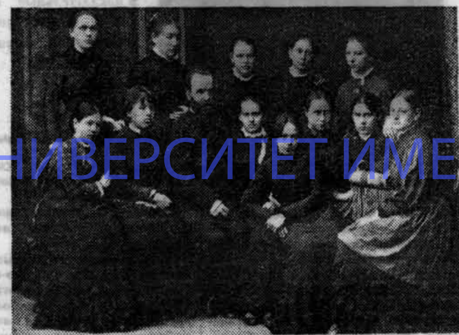
П. Ф. Лесгафт с курсистками первого выпуска (1897 г.).