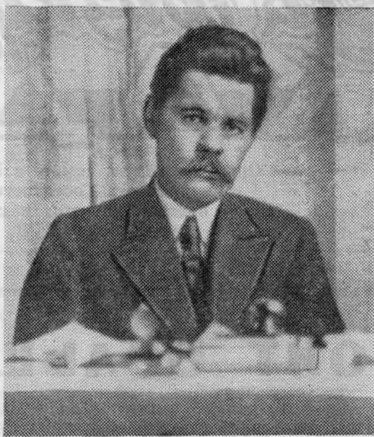
А. М. Горький. (1914 г. Сестрорецк).

М. М. Ковалевского М. Горький знал как издателя журнала «Вестник Европы» и как видного общественного деятеля России. М. Горький организовал, а затем и опубликовал написанный К. А. Тимирязевым очерк «Памяти друга (воспоминания о М. М. Ковалевском)» в издаваемом им журнале «Летопись» (1916 г., № 8).