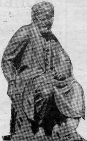
Памятник П. Ф. Лесгафту

П РЕКРАСНА, благородна профессия педагога. Она не менее романтична, чем профессия геолога, моряка, летчика, так как дает возможность в настоящем видеть будущее.