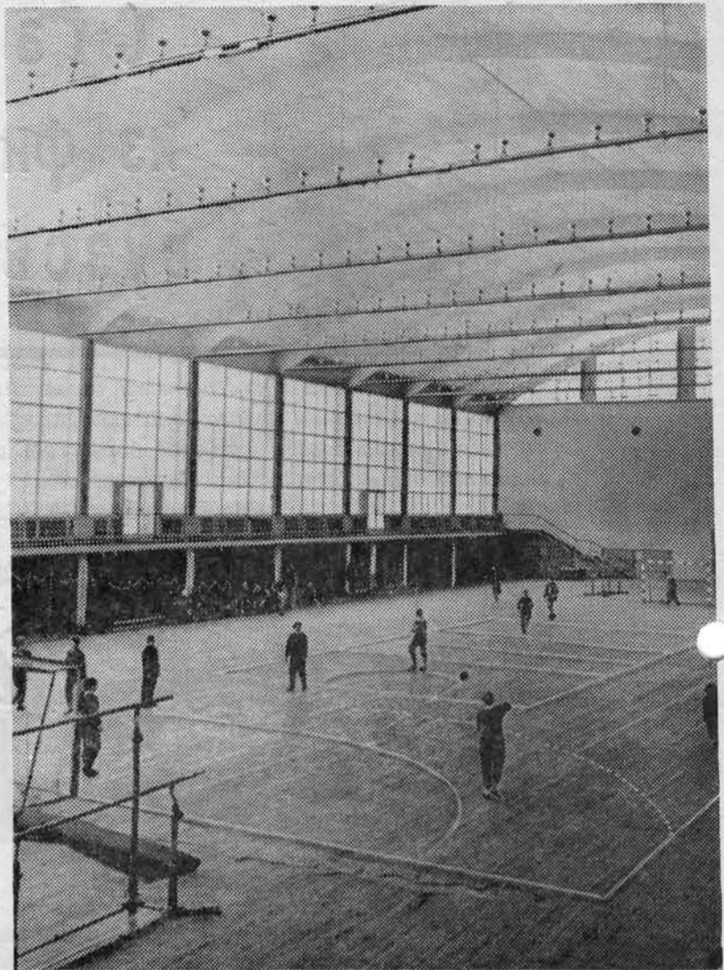
Главный спортивный зал института

Несомненно, не только очень важно записать отдельные характеристики спортсмена, но и интересно, необходимо записать на кинолентку спортсмена в его движении как нечто целое, и тренер или преподаватель физического воспитания должен хорошо владеть методами киносъемки. Спортивная техника и спортивные снаряды все время совершенствуются. Поэтому на долю исследователя падает задача — исследовать эту новую техни-