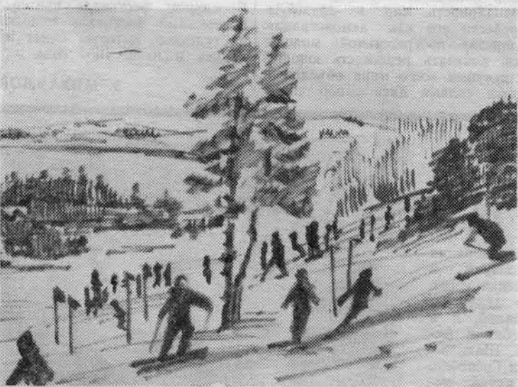
На слаломной горе