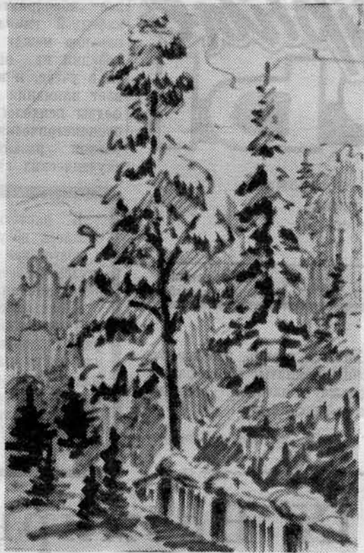
Там же знакомый уголок