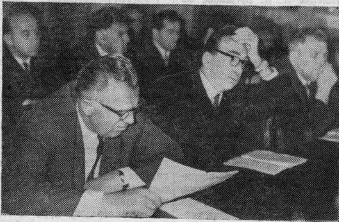
В зале во время конференции.