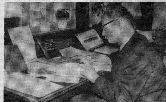
Много интересных материалов было на выставке.