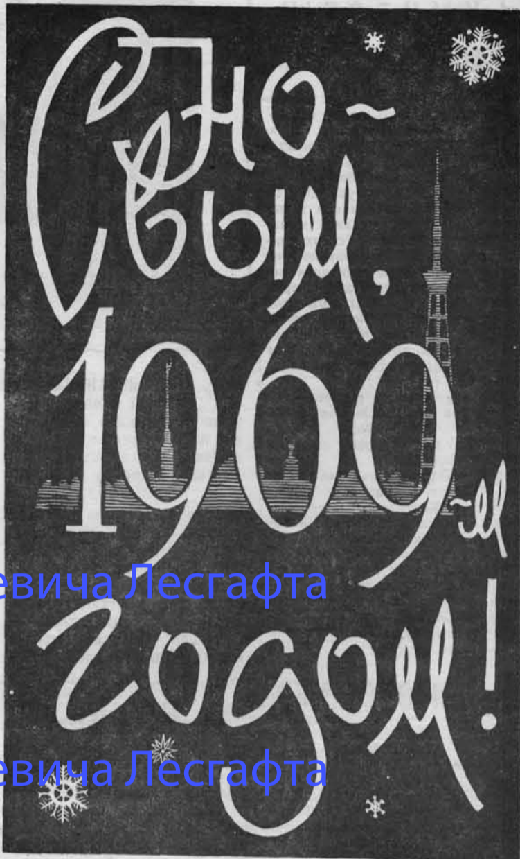
Плакат художника В. Светозарова.