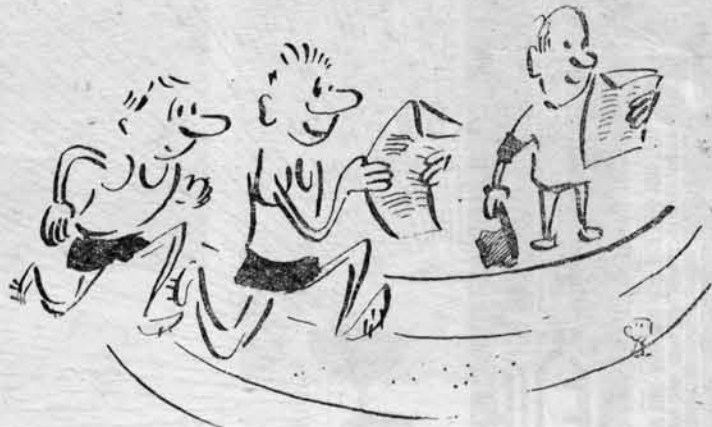
Пришла свежая газета.

Было обсуждено предложение о расширении связи актива с редколлекцией, о разнообразии в освещении хода выполнения Ленинского зачета в институте, о необходимости выпуска стенок газет на курсах и т. д.