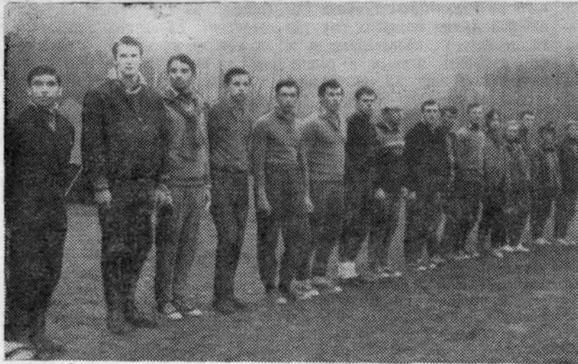
НА СНИМКАХ: сверху слева — лесгафтовцы — участники 6-го слета; справа — последние указания перед соревнованиями; внизу — «Во-первых, нужно побриться...»