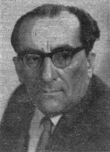
ТОВСТОНОГОВ Георгий Александрович ПЕТРОГРАДСКИЙ ИЗБИРАТЕЛЬНЫЙ ОКРУГ № 51