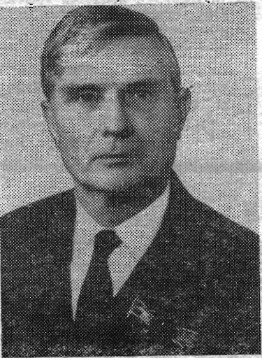
СУСЛОВ Михаил Андреевич ОКТЯБРЬСКИЙ ИЗБИРАТЕЛЬНЫЙ ОКРУГ № 50