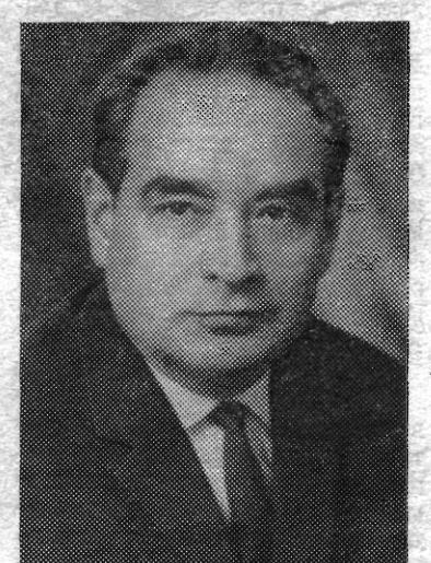
ПОПОВ Георгий Иванович