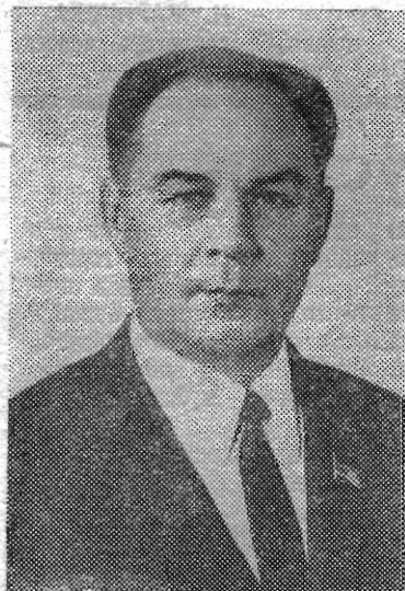
ШЕЛЕПИН Александр Николаевич

ЛЕНИНГРАДСКИЙ ГОРОДСКОЙ ИЗБИРАТЕЛЬНЫЙ ОКРУГ № 19