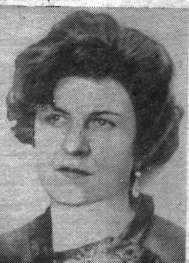
БЕХТЕРЕВА Наталья Петровна