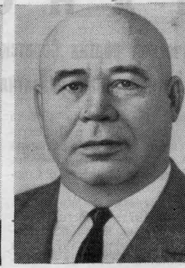
П. Е. ШЕЛЕСТ. Член Политбюро ЦК КПСС.