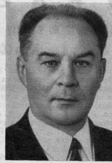
А. Н. ШЕЛЕПИН. Член Политбюро ЦК КПСС.