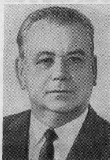
А. П. КИРИЛЕНКО. Член Политбюро ЦК КПСС, секретарь ЦК КПСС.