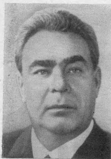
Л. И. БРЕЖНЕВ. Член Политбюро ЦК КПСС, Генеральный секретарь ЦК КПСС.