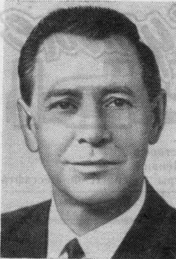
П. М. МАШЕРОВ. Кандидат в члены Политбюро ЦК КПСС.