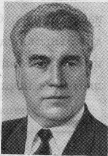
П. Н. ДЕМИЧЕВ. Кандидат в члены Политбюро ЦК КПСС, секретарь ЦК КПСС.