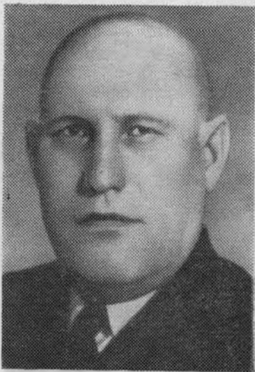
Г. Ф. СИЗОВ. Председатель Центральной ревизионной комиссии КПСС.

Пленум утвердил председателем Комитета партийного контроля при ЦК КПСС товарища Пельше А. Я.