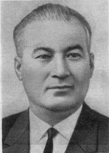
Ш. Р. РАШИДОВ. Кандидат в члены Политбюро ЦК КПСС.