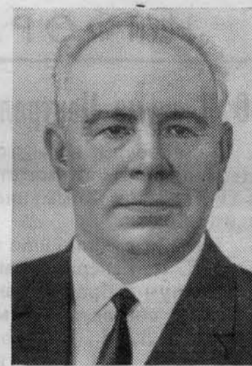
Н. В. ПОДГОРНЫЙ. Член Политбюро ЦК КПСС.