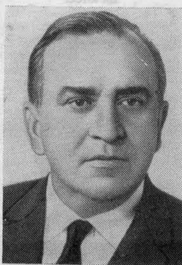
В. В. ГРИШИН. Член Политбюро ЦК КПСС.