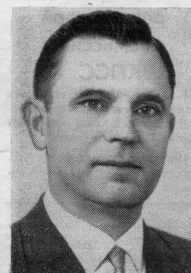
Д. С. ПОЛЯНСКИЙ. Член Политбюро ЦК КПСС.