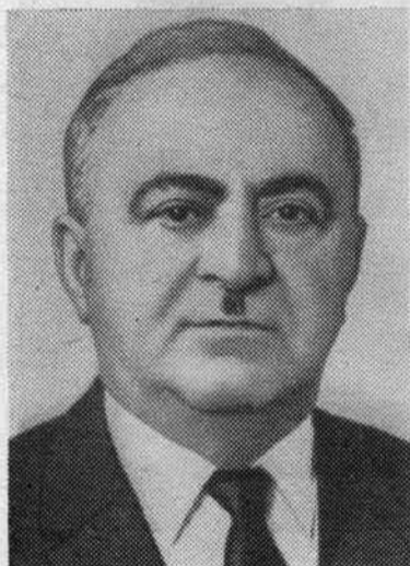
В. П. МЖАВАНАДЗЕ. Кандидат в члены Политбюро ЦК КПСС.