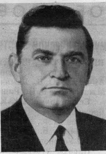
К. Т. МАЗУРОВ. Член Политбюро ЦК КПСС.