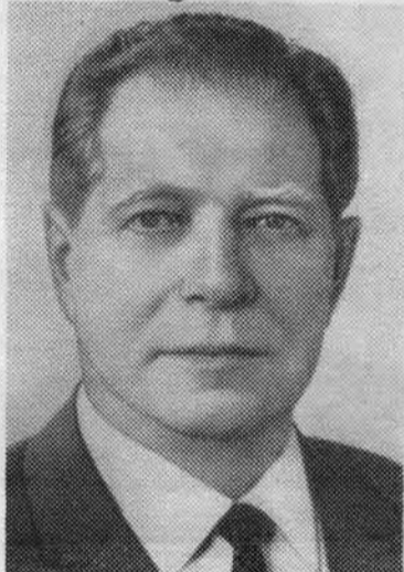
Д. Ф. УСТИНОВ. Кандидат в члены Политбюро ЦК КПСС, секретарь ЦК КПСС.