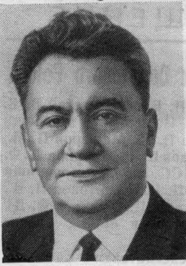
Д. А. КУНАЕВ. Член Политбюро ЦК КПСС.