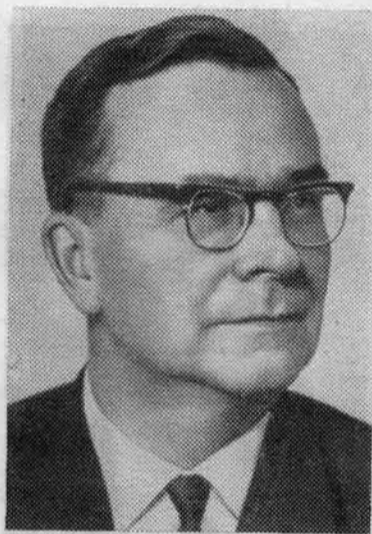
Г. И. ВОРОНОВ. Член Политбюро ЦК КПСС.