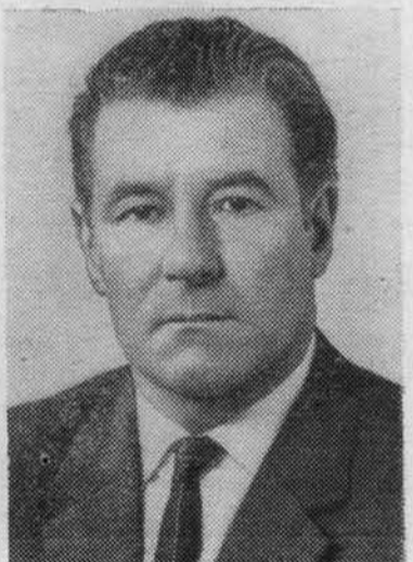
М. С. СОЛОМЕНЦЕВ. Секретарь ЦК КПСС.