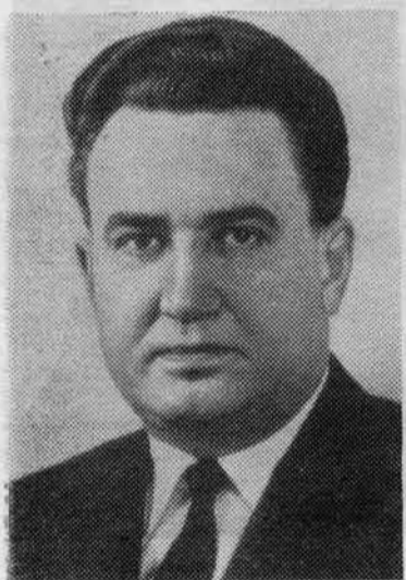
Ф. Д. КУЛАКОВ. Член Политбюро ЦК КПСС, секретарь ЦК КПСС.