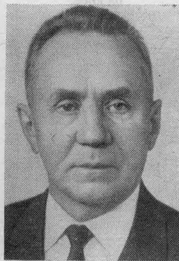
А. Н. КОСЫГИН. Член Политбюро ЦК КПСС.