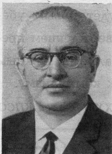
Ю. В. АНДРОПОВ. Кандидат в члены Политбюро ЦК КПСС.