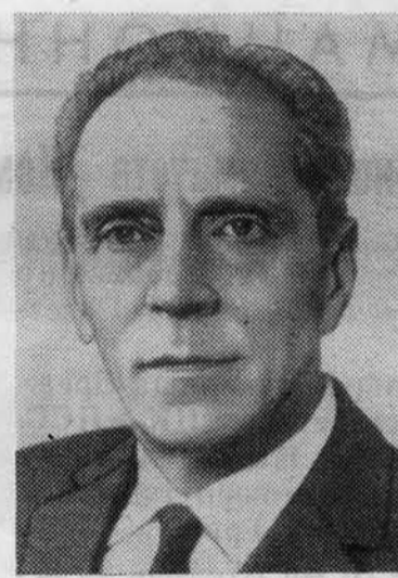
А. Я. ПЕЛЬШЕ. Член Политбюро ЦК КПСС, председатель КПК при ЦК КПСС.