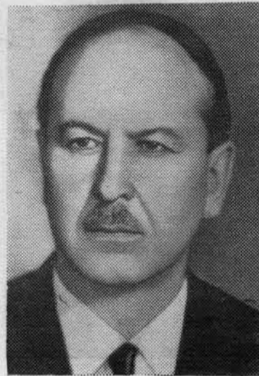
Б. Н. ПОНОМАРЕВ. Секретарь ЦК КПСС.