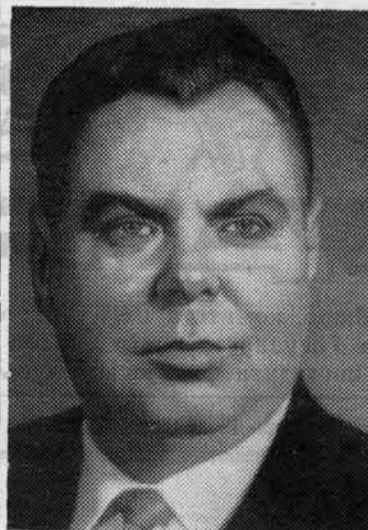
И. В. КАПИТОНОВ. Секретарь ЦК КПСС.