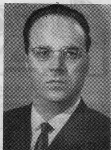
К. Ф. КАТУШЕВ. Секретарь ЦК КПСС.