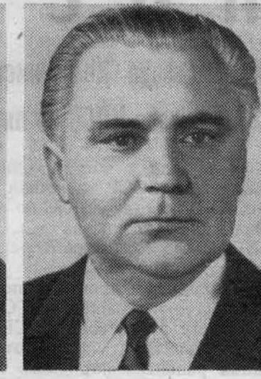
В. В. ЩЕРБИЦКИЙ. Член Политбюро ЦК КПСС.