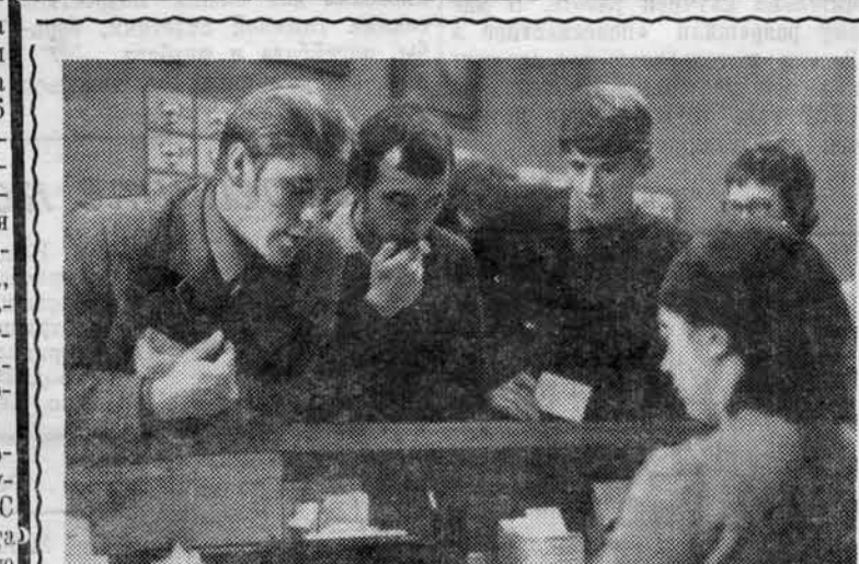
На абонементе библиотеки.