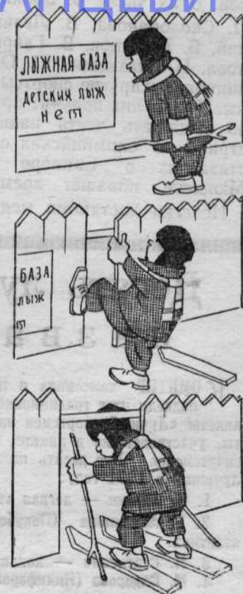
Рис. И. Коновалова