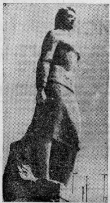
ПАМЯТНИК Клаве Назаровой в г. Острове.

ЛЕСГАФТОВЦЫ всегда были в первых рядах защитников своей великой Родины.