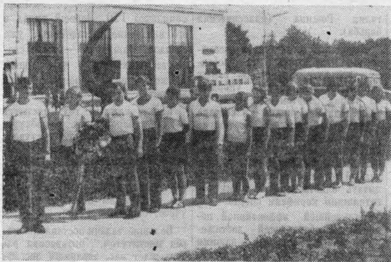
На снимках: учащиеся школы тренеров у памятника Герою Советского Союза Клавдии Назаровой.