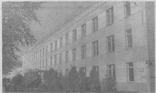
Главное здание института.