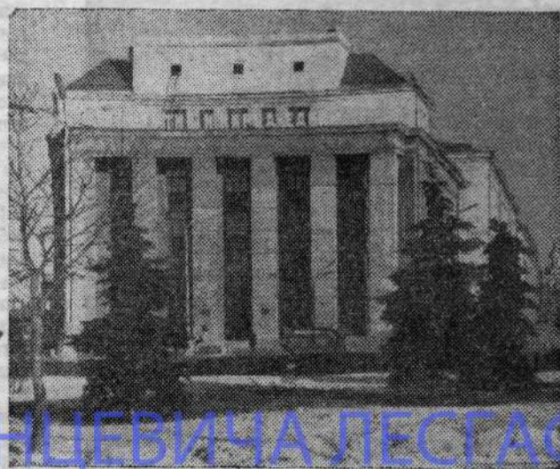
Главное здание БГОИФК.

В жизни каждого есть периоды становления, периоды роста. Приходит и пора зрелости. 35-летие для БГОИФК — пора зрелости. И коллектив института гордится тем, что его считает лидером белорусского спорта.