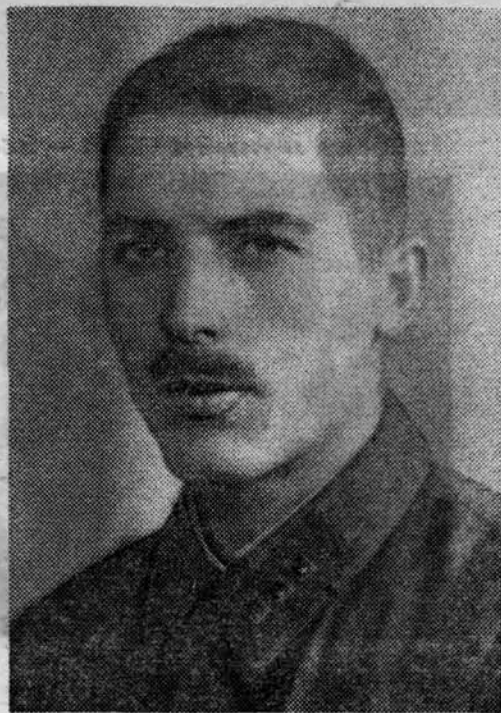
СЛОВО О ПЕРВОМ РЕДАКТОРЕ