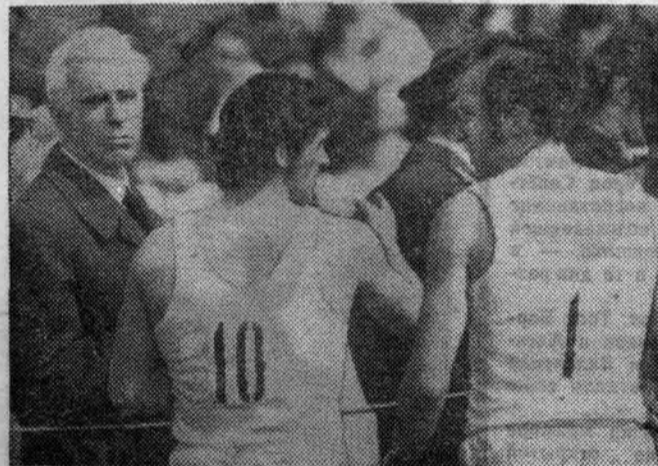
Последние напутствия тренера...