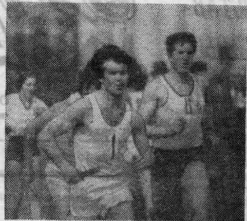
Борьба на этапах была острой.