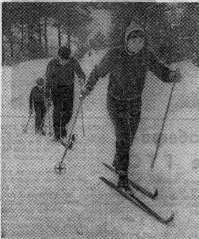
НАШИ студенты на первой лыжне сезона в Кавголове.