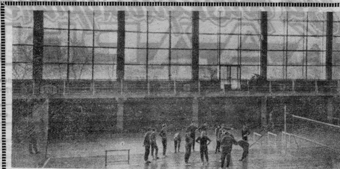
ГЛАВНЫЙ СПОРТИВНЫЙ ЗАЛ ИНСТИТУТА. Идет тренировка.