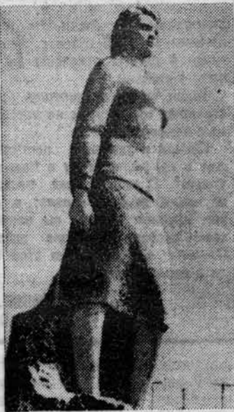
Памятник Клавдии Назаровой в г. Острове.

ЛЕСГАФТОВЦЫ всегда были в первых рядах защитников своей великой Родины.