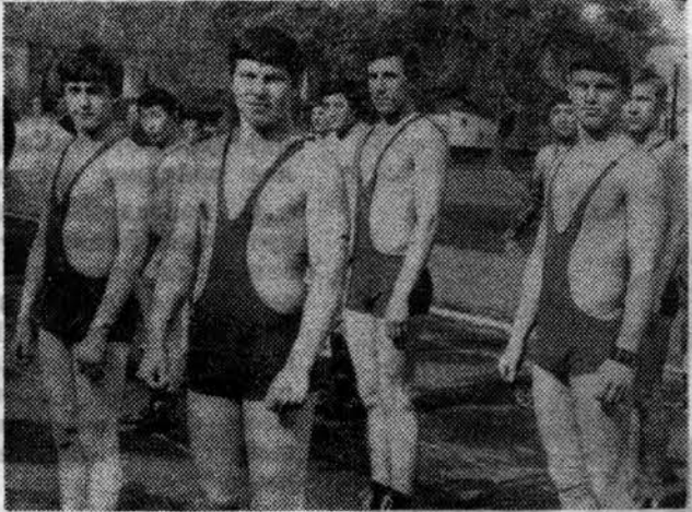
В строю — спортсмены-борцы.