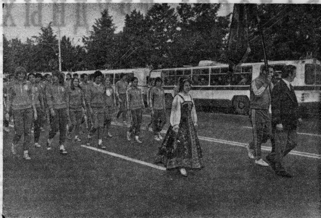
ТОРЖЕСТВЕННОЕ открытие Спартакиады. Идет колонна лесгафтовцев.